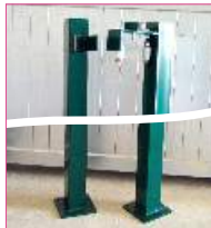
POTEAU À VISSER